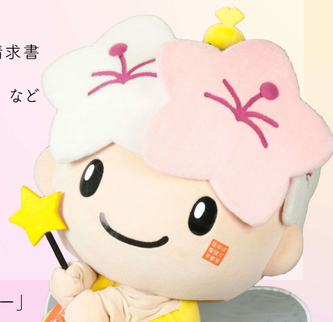
宇都宮市マスコットキャラクター「ミヤリー」