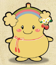
栃木県 老人福祉施設協議会 イメージキャラクター とちふくちゃん