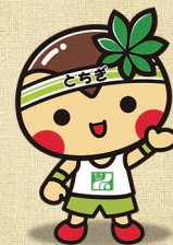
栃木県マスコット キャラクター とちまるくん